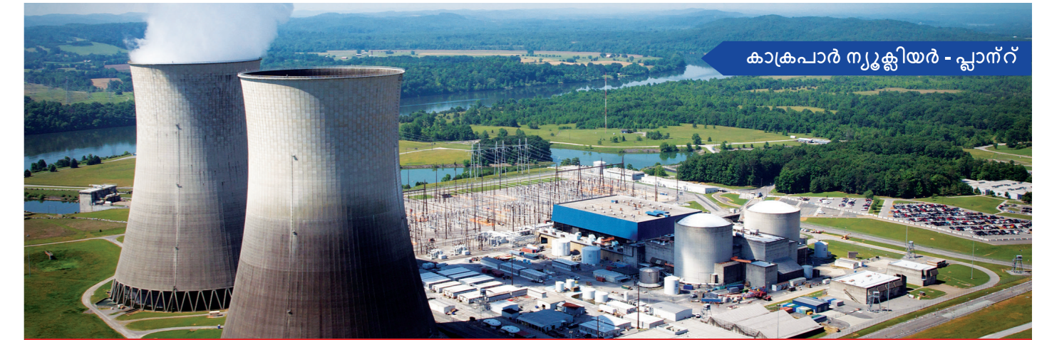
കാക്രപാർ ന്യൂക്ലിയർ - പ്ലാന്റ്