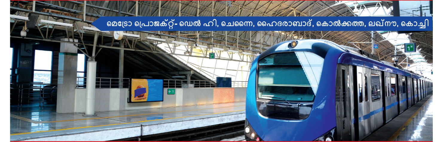
മെട്രോ പ്രൊജക്ട്- ഡെൽ ഹി, ചെന്നൈ, ഹൈദരാബാദ്, കൊൽക്കത്ത, ലഖ്നൗ, കൊച്ചി