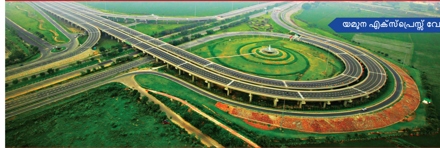
യമുന എക്സ്പ്രസ്സ് വേ