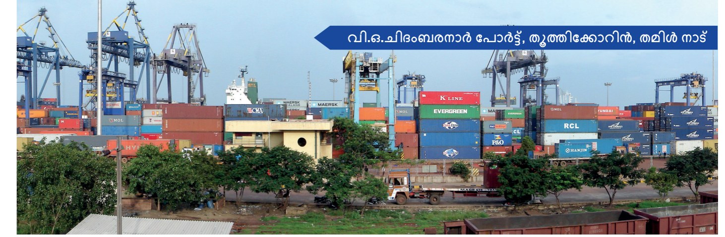
വി.ഐ.ഐ.ബരനാർ പോർട്ട്, തൃശ്ശൂർ, തമിഴ് നാട്