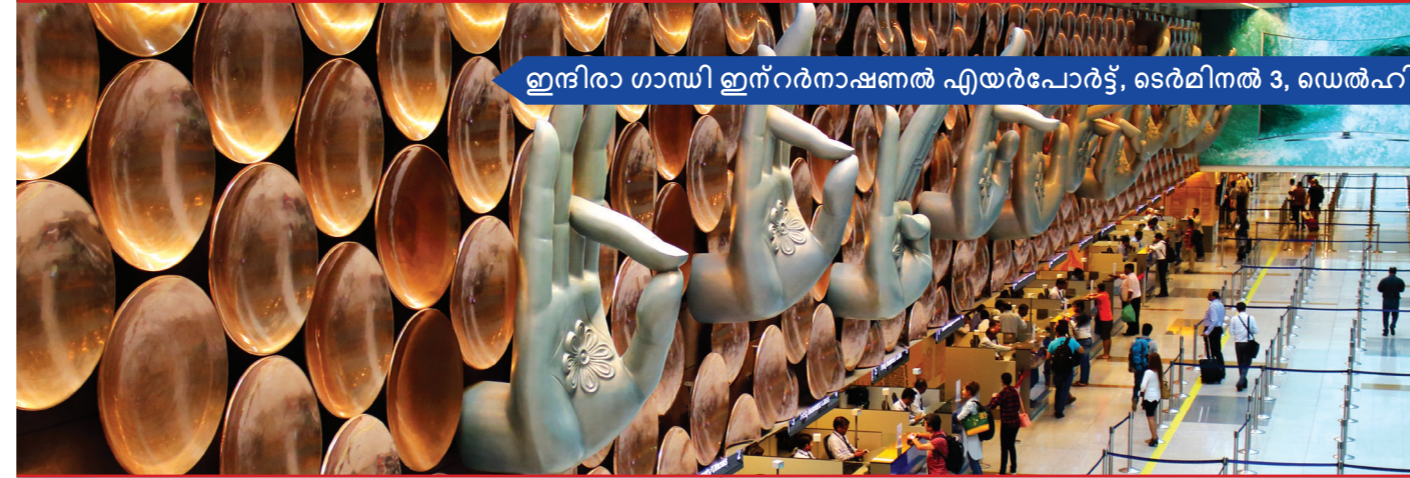
ഇന്ദിരാ ഗാന്ധി ഇന്റർനാഷണൽ എയർപോർട്ട്, ടെർമിനൽ 3, ഡെൽഹി