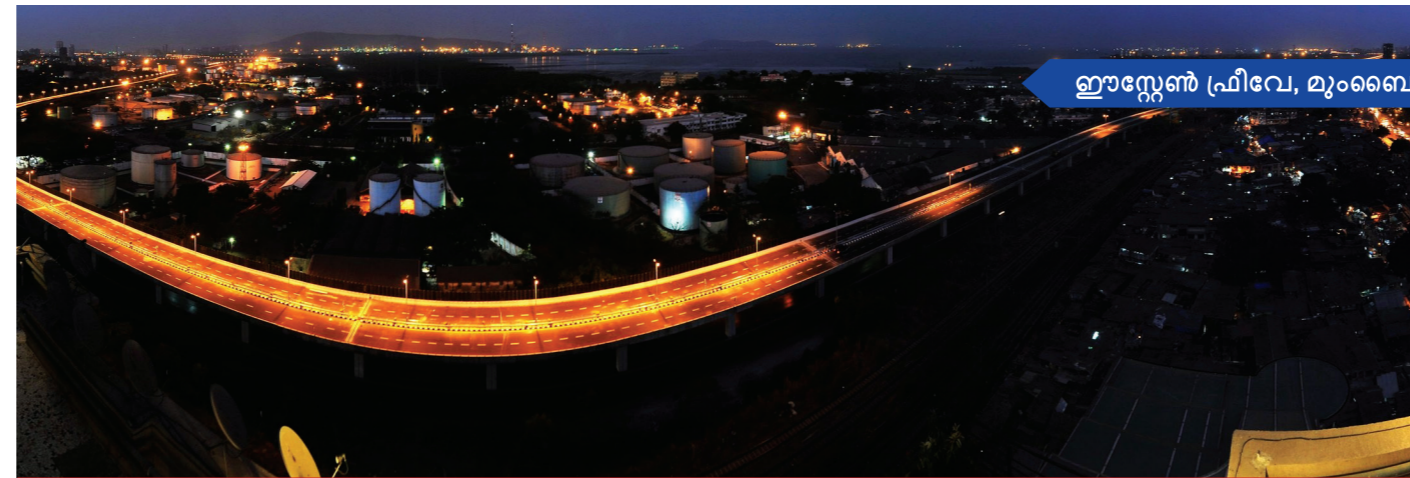
ഈസ്റ്റേൺ പ്രിവേ, മുംബൈ